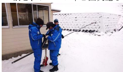
(従業員による救助訓練)