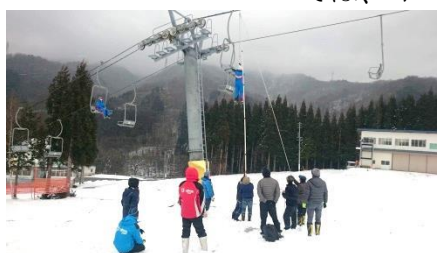
(オープン前の新人研修訓練)

当スキー場では、お客様を安全に輸送するために、シーズン営業開始前に、運転細則及び安全管理規程などで職員に教育を行っており、又、救助訓練については、オープン前と、シーズン中2回実施しました。