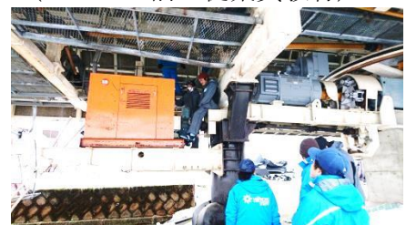
(第3クワッドリフト緊急時の訓練及び、予備原動機の稼働訓練)