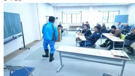
(シーズン前の従業員教育)