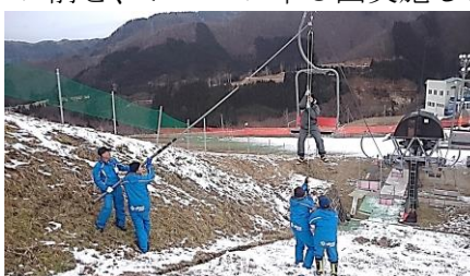
(従業員による救助訓練)