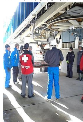
(第3クワッドリフト緊急時の訓練及び、予備原動機の稼働訓練)