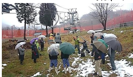
(オープン前の新人研修訓練)

当スキー場では、お客様を安全に輸送するために、シーズン営業開始前に、運転細則及び安全管理規程などで職員に教育を行っており、又、救助訓練については、オープン前と、シーズン中3回実施しました。