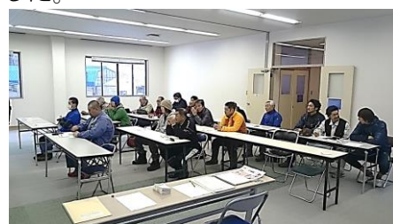
(シーズン前の従業員教育)